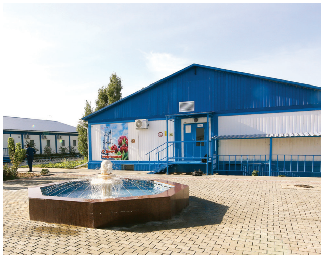
Территория вахтового посёлка месторождения Нуралы

(местные, республиканские и зарубежные журналисты, представители профильного министерства, работники нефтяных компаний из других регионов Казахстана) всегда подчёркивали, что на месторождениях КГМ царят чистота и порядок. А в условиях продолжающейся пандемии коронавирусной инфекции данный подход стал большим плюсом компании. Поддержание чистоты теперь не просто эстетическая или производственная норма, но и необходимая составляющая для обеспечения безопасных условий труда. Ежедневная влажная уборка производственных и жилых помещений теперь происходит с обязательным применением дезинфицирующих средств. А для дезинфекции транспорта был приобретен специальный тоннель.