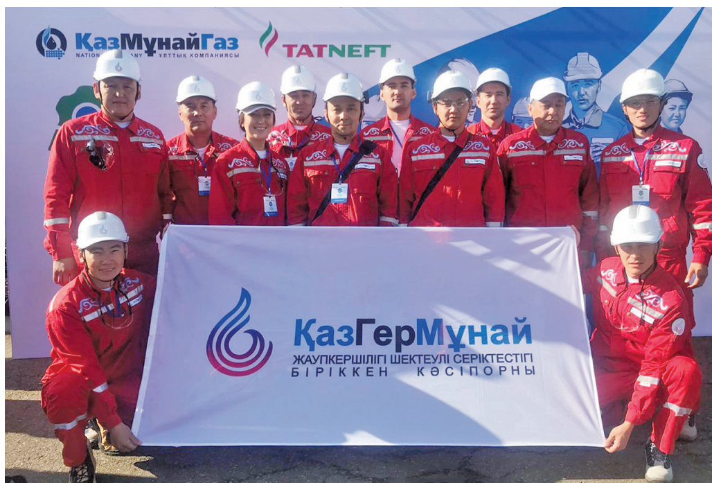
Работники «Казгермунай» – победители и призёры конкурса «Үздік маман 2019» среди группы компаний АО НК «КазМунайГаз»

Необходимо отметить, что важной составляющей культуры труда отдельного работника является и его желание, и способность постоянно развиваться и самосовершенствоваться. И ТОО «СП «Казгермунай» на протяжении всех лет существования оказывает всяческую поддержку и создаёт условия для подготовки, переподготовки и профессионального обучения своих сотрудников. Стоит отметить, что это имеет отношение не только к инженерно-техническому составу, но и к рабочим профессиям. Доказательством тому служит успешное участие представителей рабочих специальностей «Казгермунай» в ежегодных конкурсах профессионального мастерства на звание «Үздік маман» сначала на внутреннем – среди сотрудников компании, а затем региональном – среди работников дочерних компаний АО НК «КазМунайГаз». Необходимо упомянуть и масштабную аттестацию работников производственного персонала (рабочих профессий) на определение уровня квалификации, проведённую в компании в 2019 году. В течение года было аттестовано 382 работника: 87% из них успешно прошли аттестацию и подтвердили свою квалификацию, 152 работника, набравшие самые высокие баллы, были повышены в квалификационных разрядах, а 7 работников в связи с отсутствием вакантных мест в своих подразделениях были